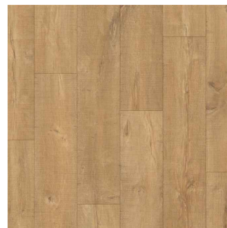
Piso laminado Carvalho Natural Serrado 1380mm x 190mm Linha Eligna Wide Quick Step 18,06m²